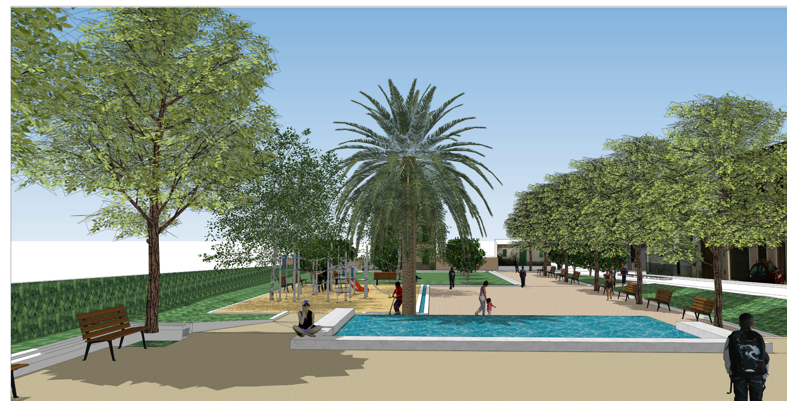
V7. Part central de la plaça amb el safareig i el fasser