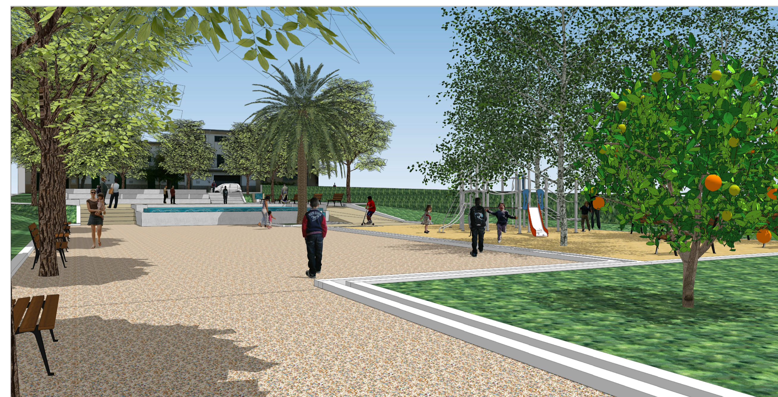
V9. La zona de jocs vista des del passeig