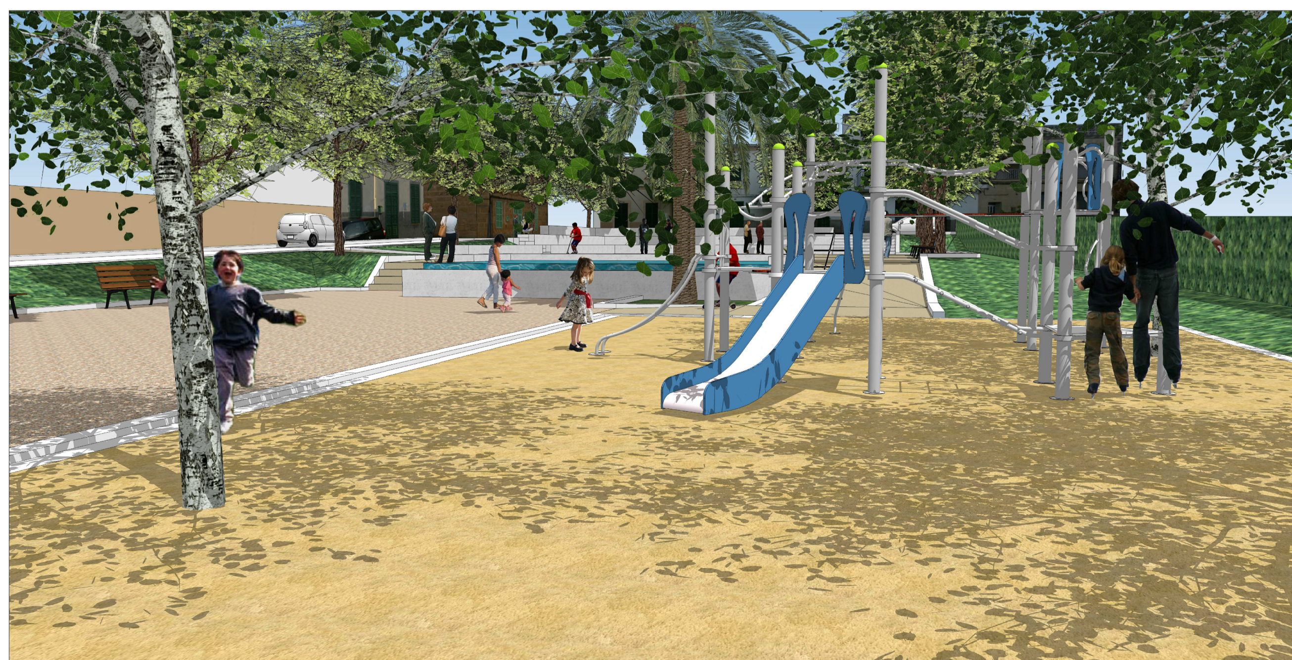
V10. La zona de jocs del centre de la plaça