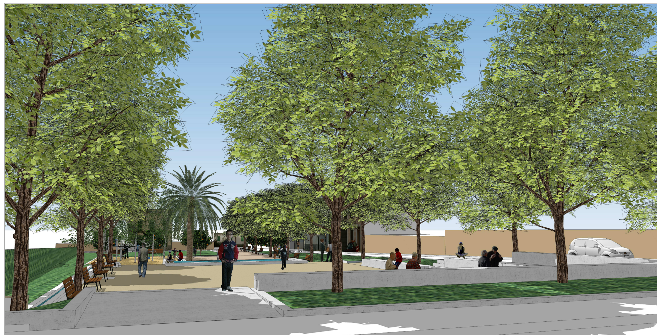
V6. Vista de la plaça des del carrer superior