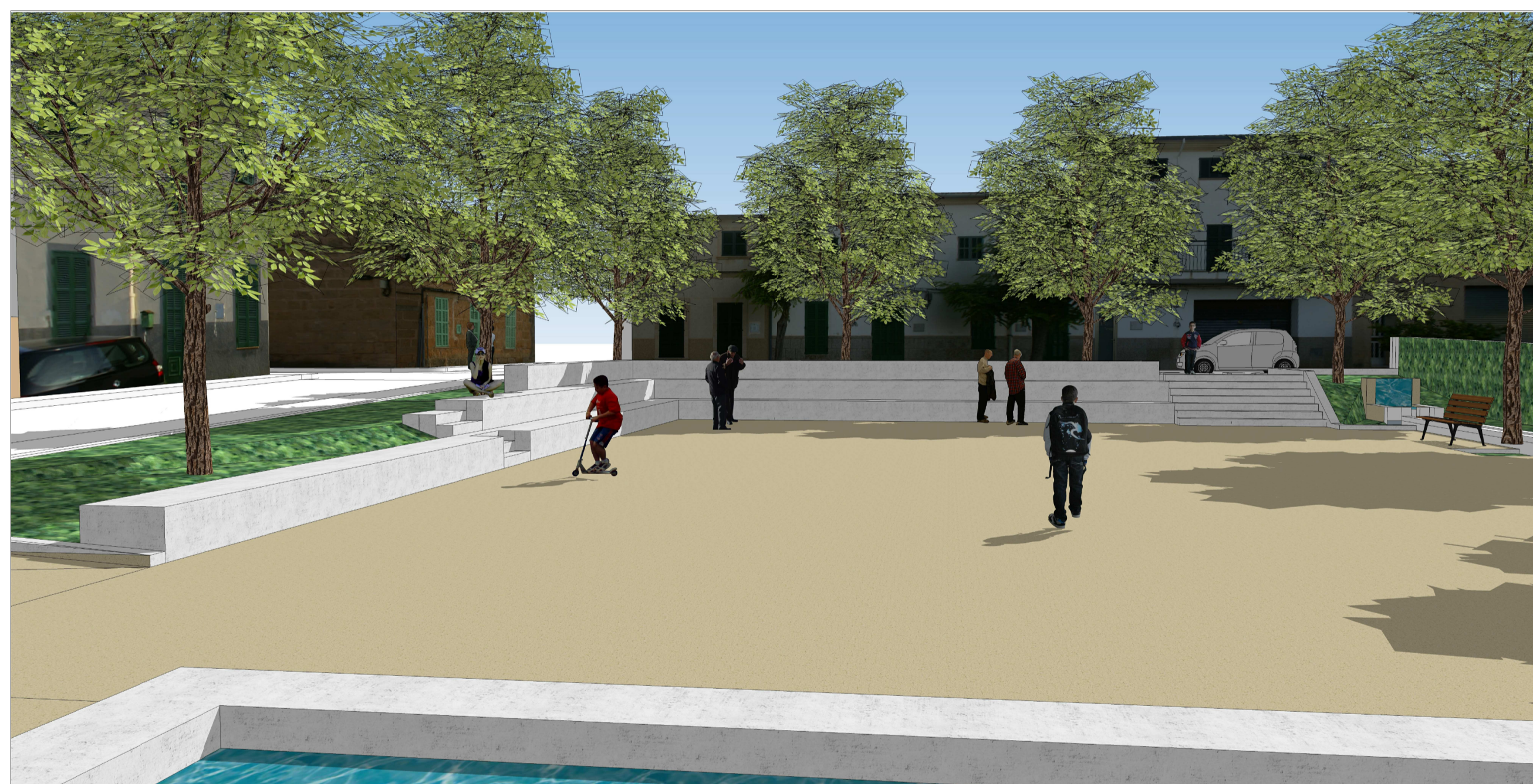
V8. Les grades vistes des de la zona del safareig