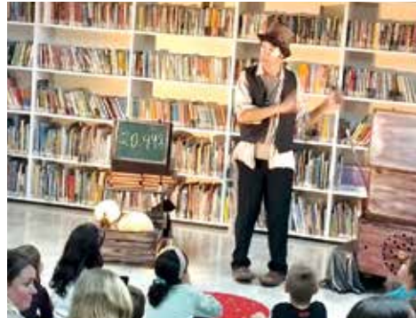
CLOWNÓMADAS ESTRENA Illes Balears Màgia i clown