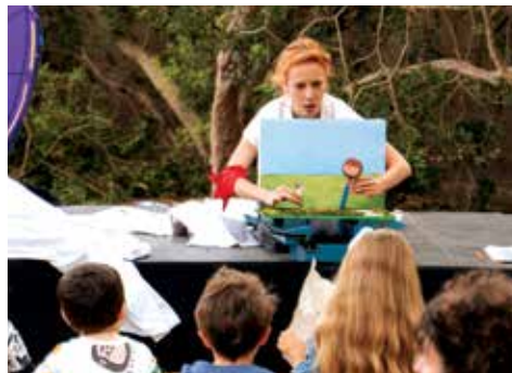
VIATGE AL MÓN DE N'AINA ESTRENA Illes Balears Teatre d'objectes